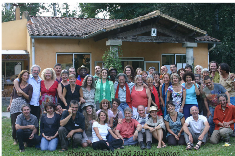
Photo de groupe à l'AG 2013 en Avignon

Au mois de janvier, la liste de diffusion sera revue et seuls les conteuses et conteurs à jour de leur adhésions recevront les informations.